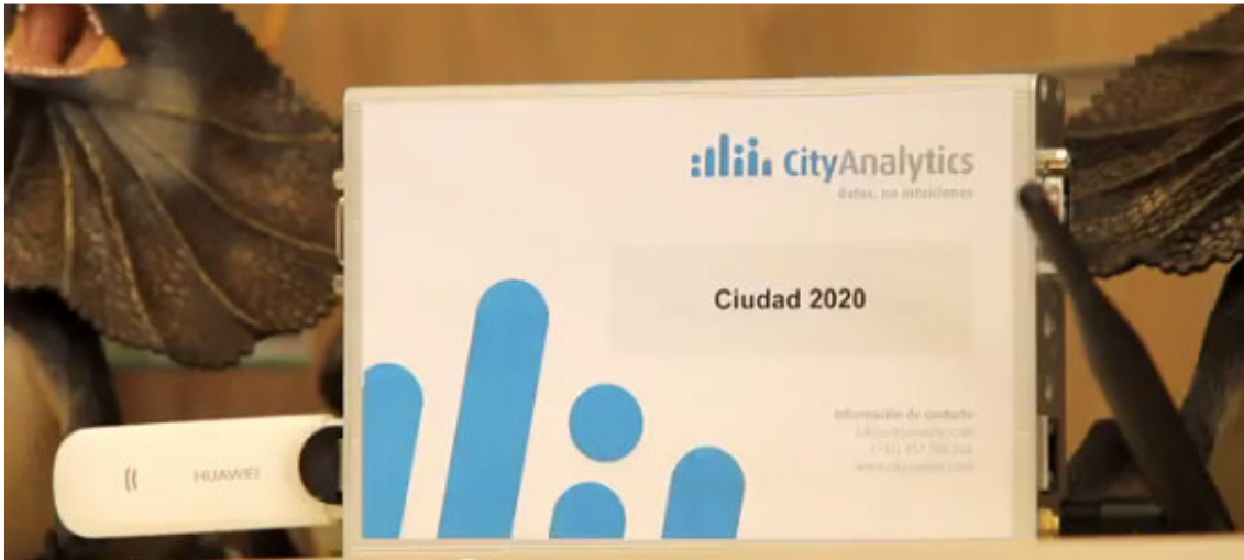
Fig. 2: Dispositivo Intelify con el modem USB para conexión 3G conectado