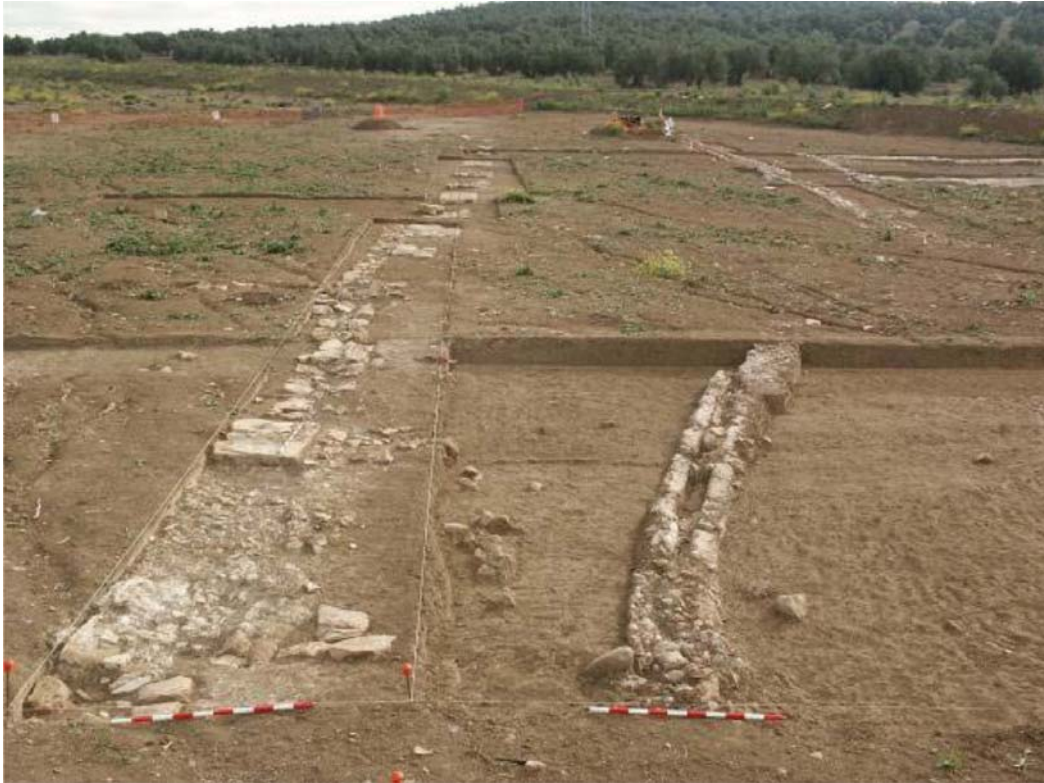
Cortijo de “El Ahorcado”. Acueducto romano.