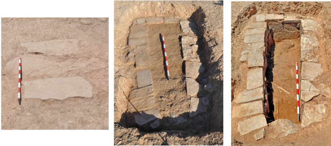
TUMBA SELLADA → EN PROCESO DE EXCAVACIÓN → PLANTA FINAL

Respecto a la segunda zona, todos los sondeos resultaron negativos, excepto el sondeo primero, donde se localizó una estructura con material cerámico que se adscribe a la época ibero-romana .