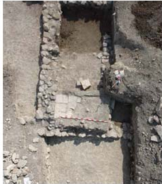
Planta y fotografía aérea de la Estancia. Suelo de tegulae.

Los restos estructurales identificados están datados de la época romana , principalmente con edificaciones organizadas con habitaciones interiores y estancias con funciones y dotaciones diversas. En algunas de estas estancias aparecen restos de teselas fragmentadas de revés y con los cantos rematados, indicando su empleo como solado.