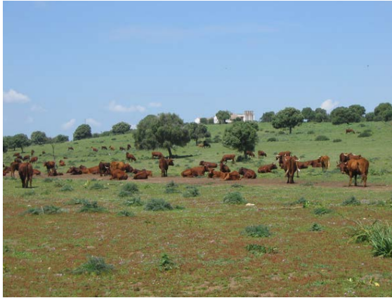
Fig. 4: La ganadería bovina: ejemplo de actividad económica tradicional en la comarca.

y determinaciones específicos de los planes territoriales. En este sentido, la presente investigación pretende también avanzar en la adaptación de la LCA al marco territorial, administrativo e instrumental vigente en Andalucía, adecuándola a las necesidades y posibilidades que ofrecen actualmente los procesos de planificación subregional en la Comunidad Autónoma.