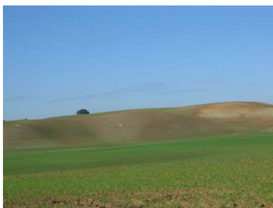
Fig. 2: Tierras de labor en las Campiñas de Medina Sidonia.

Es preciso reseñar igualmente, como circunstancia que aconseja profundizar en la consideración del paisaje en las políticas públicas de Andalucía, la aprobación del nuevo Estatuto de Autonomía (Ley Orgánica 2/2007), que además de incluir el respeto al paisaje entre los principios rectores de la actuación de los poderes públicos (Art. 37), reconoce de manera explícita el derecho de los ciudadanos a disfrutar de los recursos paisajísticos en condiciones de igualdad (Art. 28.1 y 33). Atendiendo a estos preceptos emanados del Estatuto, los poderes públicos de la Comunidad Autónoma deben promover la adecuada protección, gestión y ordenación del paisaje a través de las políticas e instrumentos encargados de desarrollar las competencias que tienen legalmente atribuidas.