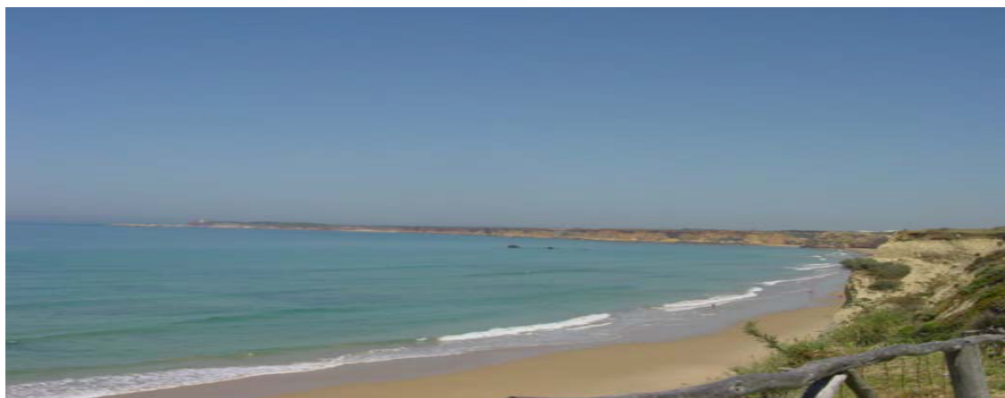
Fig. 6: Ensenada en el ámbito de estudio.