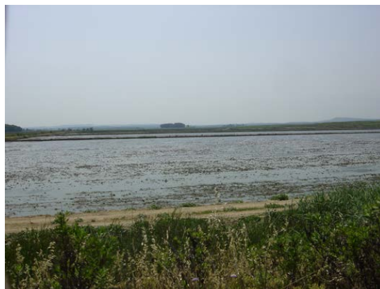
Fig. 3: Marismas del Barbate.

Este ejercicio teórico y relativamente descontextualizado de la realidad paisajística de Andalucía constituye un referente fundamental para el presente proyecto de investigación que busca, en última instancia, concretar los conceptos, procedimientos y criterios sobre los que sustentar el reconocimiento y el tratamiento del paisaje en los instrumentos de planificación territorial. Una vez establecido el procedimiento operativo básico se pretende llevar a cabo su calibrado y mejora a través de un ejercicio práctico en un ámbito territorial específico definido a partir de propósitos de planificación. Finalmente, el proyecto promoverá su vinculación con las actuaciones de la Administración competente en la materia por medio de un documento en el que se establezcan los contenidos y prescripciones paisajísticas a incorporar en los procedimientos de contratación y redacción de los futuros planes subregionales.