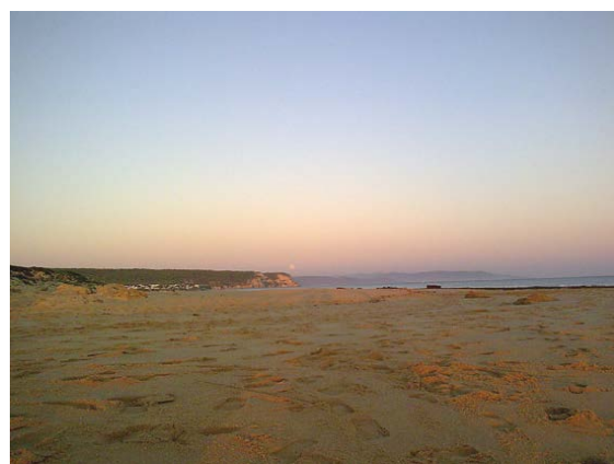
Fig.5: Formaciones arenosas y acantilados.

Desde el punto de vista metodológico cabe señalar como referencia básica para la implementación del presente proyecto al procedimiento británico de Estimación del Carácter Paisajístico (Landscape Character Assessment, LCA) La operatividad y aplicabilidad del método han contribuido sustancialmente a su difusión en el contexto internacional, constituyendo uno de los modelos básicos a la hora de llevar a cabo la identificación, caracterización, cualificación y tratamiento de los recursos paisajísticos presentes en el territorio. Es preciso señalar que, como cualquier planteamiento científico – técnico general, la LCA requiere de una cierta modulación a la hora de ser implementada en un contexto diferente al que le dio origen, así como a los procedimientos