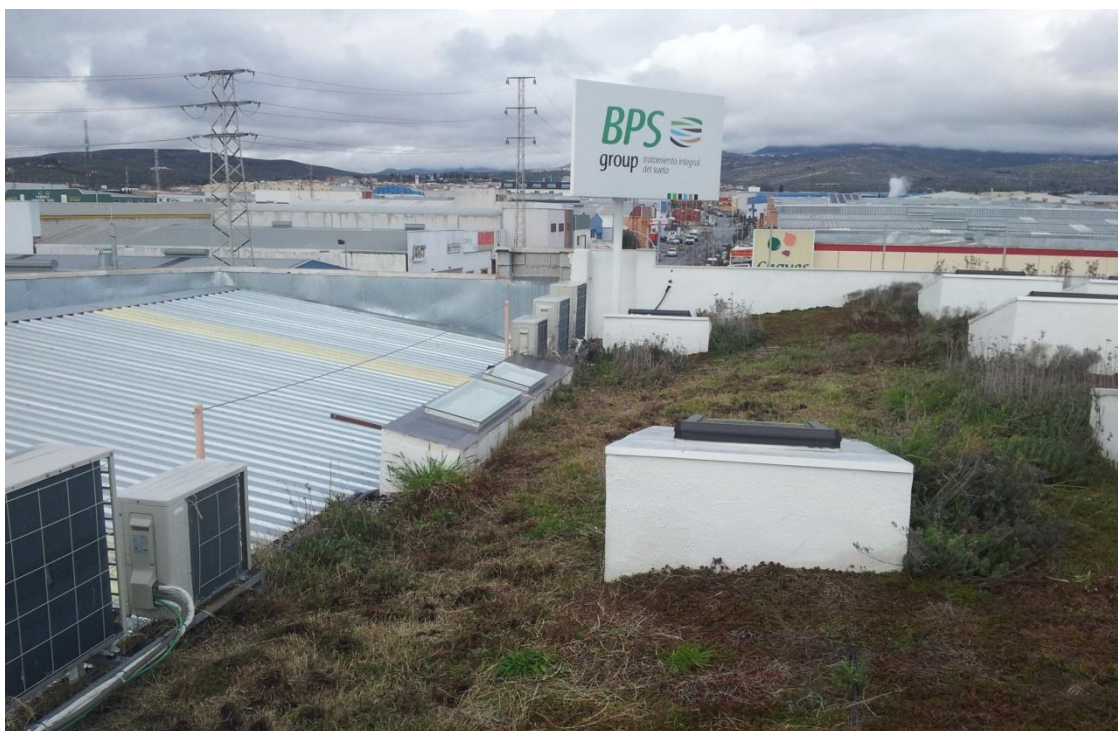
Fig. 2: Techo verde extensivo en polígono de Peligros, Granada.

Los techos verdes más prometedores desde el punto de vista coste-beneficio para una implantación amplia en Andalucía son los techos verdes extensivos. Presentan una profundidad de sustrato entre 5 y 15 cm y una vegetación resistente, que requiere escaso mantenimiento, excepto un riego de apoyo durante los meses de verano. Sin embargo, mientras que la humedad del sustrato es el principal factor que controla las características de transmisión y retención de calor, no existen datos sobre la estrategia de riego más óptima. La humedad del sustrato ha de variar dentro de unos límites para que el techo verde pueda mantener la capa de vegetación. Las especies de Sedum se usan mucho en techos verdes extensivos en todo el mundo, aunque no existen estudios sobre el potencial de especies autóctonas mediterráneas con presencia en Andalucía, la mayor parte de las cuales están bien adaptadas para sobrevivir a periodos de sequía de intensidad variable.