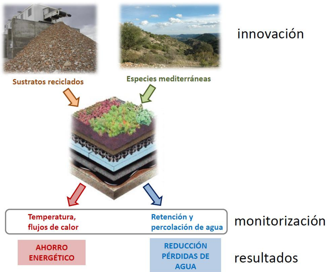
Fig. 3: Esquema de los objetivos, la innovación y los resultados previsibles del proyecto.