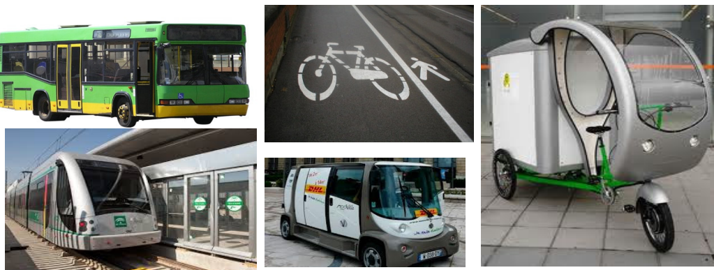
Fig. 2: Algunos de los modos de transporte de mercancía a considerar en el proyecto

Para este fin, se trabajará en aspectos relacionados con la adecuada planificación e integración logística de la cadena de transporte de la mercancía urbana, así como el análisis de los factores que faciliten la utilización de vehículos no contaminantes apropiados para la distribución urbana y que aprovechen sus infraestructuras propias (carril bicicleta, transporte público, vehículos eléctricos o poco contaminantes, etc.).